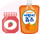
과채음료, 잼 등 안식향산