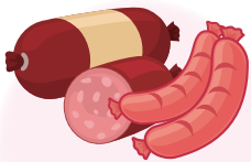
햄, 소시지 등 소브산