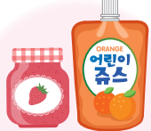
과채음료, 잼 등 안식향산